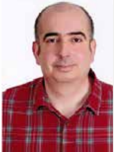
دكتور بروفيسور حسين علي غالب بابان

قام شخص يعمل مندوباً لجهة تدعي أنها مؤسسة مجتمع مدني ولها رموز و مؤيدون وداعمين ومقرات في عدة دول عربية منها وأجنبية، بالاتصال بي في الأيام الماضية لأنه وجدني أكتب في صحف ومجلات ومواقع كثيرة ، فتوقع بكل بساطة أنني زيون سهل اصطياذه، وبالفعل قدم عرض خاص لي مقابل مبلغ مادي، بالنسبة لي هو مبلغ تافه جداً لا يذكر لكن هو يعتبر مصدر دخل له لأن كلما زادت نسبة بيعه تزيد نسبة أرباحه التي تدخل إلى جيبه وبالتأكيد هذا العرض قدم لكثيرين، ولست أنا الوحيد والمميز بين كل بنى البشر .