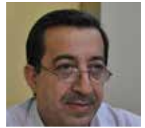
اعدّه وقدمه : فارس السردار

للون من خصائص دلالية فيزيائية وكيميائية ووجدانية وروحية، جاءت في هذه اللوحات خاصة، مبهرة وشادة لعين الزائي ورؤياه في أن معاً.