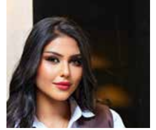
بقلم الإعلامية إسراء الجوراني

ويلاحظ بان العديد من مشاهير التواصل الاجتماعي الحاليين يعيشون خارج بلدانهم الام، مثل تركيا ودبي ودول أوروبا وأمريكا، ويقومون بتصدير ثقافات وقيم غير مألوفة للمجتمع الاسلامي الذي يعيش فيه معظم افراد الفئة المتلقية لهذا المحتوى، وما في ذلك من خطورة على المجتمعات العربية المحافظة ومنظومة القيم والعادات الاجتماعية والموروث الديني والاخلاقي السائد، فمن الصعوبة السيطرة بشكل كامل على ما يمكن ان يشاهده الاطفال والمراهقين عبر مواقع التواصل الاجتماعي نظرا لكون جزء كبير من يومهم يقضونه امام شاشات الهواتف، اذ يلاحظ تشجيع هؤلاء على العلاقات المحرمة وانكار الاديان والتشكيك بالمعتقدات الدينية الثابتة. كما شاهدنا في الآونة الأخيرة استغلال بعض ضعاف النفوس للنساء للمتاجرة بأجسادهن للحصول على نسب اعلى من المشاهدات من قبل المراهقين والشباب سعيا للحصول على الشهرة والمال، وتختلف مراحل التأثير تبعا للفئة المتلقية ومستواها الفكري والاجتماعي، فضلا عن دور الرقابة الابوية التي تمارس على المتلقين لهذا المحتوى، اذ