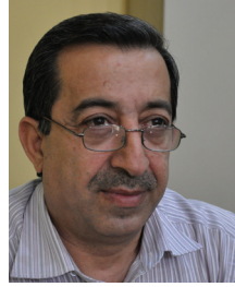
بقلم: فارس السردار

ولأن الأدب لا يعول كثيراً على النسخ أو الاقتباس أو النقل تجد ان المخيلة لديه