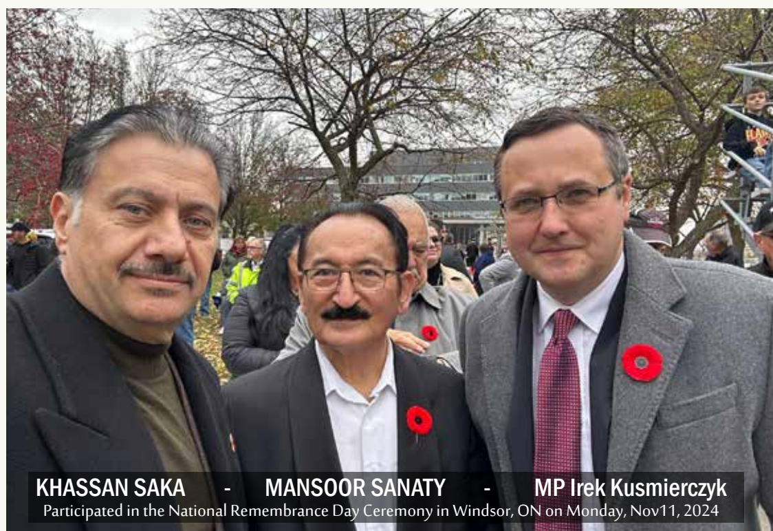
KHASSAN SAKA - MANSOOR SANATY - MP Irek Kusmierczyk Participated in the National Remembrance Day Ceremony in Windsor, ON on Monday, Nov11, 2024

The event closed with the singing of "God Save the King" and a final salute to the brave men and women who have served and continue to serve in Canada's armed forces. It was a powerful and emotional occasion, one that served as a reminder of the enduring strength of the Canadian spirit and the deep debt of gratitude owed to those who gave everything for the peace and security of their nation.