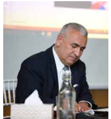
س4 ما هي الدوافع التي جعلتك تالف كتاب سفر برلك؟

حينما كنت صبيا في مرحلة المتوسطة واثم الاعدادية، كنت اطالع بشغب انجازات الامم والشعوب، واطالع تاريخ الشعوب والامبراطوريات وكيف ظهرت في التاريخ وماهي عوامل صعودها ومن ثم العوامل التي ادت الى سقوطها، طالعت عن حضارة وادي الرافدين وتاريخ الامبراطوريات التي ظهرت بكتب واجريت عدة محاضرات عنها مثل (التطور الفكر الديني في حضارة وادي الرافدين، و اهم عشرة انجازات علمية لحضارة وادي الرافدين)، و (دور اجدادنا المسيحيين النساطرة في الترجمة والتأليف في العصر العباسي). من هذه المطالعات والابحاث والمقالات والمقابلات وجدت اننا (اقصد الكلدان والاشوريين والسريان) كشعب مسيحي مشرقي ذو جذور رافدينية اصبحنا شبه محذوفين من صفحة التاريخ على الرغم من التضحيات الكبيرة التي قدمناها في المذابح والمجازر التي حصلت لنا بسبب الاضطهاد الديني منذ سقوط اخر حكم وطني لنا في عهد السلالة البابلية الاخيرة - الامبراطورية الكلدانية، حيث حكمتنا الاقوام الغربية لحد الان، فكانت اخر المذابح هي مذابح سفر برلك- او سيفو التي حصلت خلال الحرب العالمية الاولى التي راح ضحيتها 300 الف شهيد خلال السنوات الاربعة للحرب، بالإضافة الى ذلك اننا احفاد تلك الامبراطوريات العظيمة التي ظهرت في وادي الرافدين (السورية والاكدي والبابلية- الكلدانية والاشورية)، واننا اصحاب هذا الوطن الاوائل، كذلك كان لاجدادنا الفضل الكبير على العالم بسبب اكتشافهم اهم عشرة انجازات علمية قديمة في تاريخ البشرية والتي لم ولن يستطيع العالم الاستغناء عنها. فشعرت بمسؤولية اخلاقية وانسانية ان اضحي بوقتي وان افتح هذا الملف، فبدأت بجمع المصادر والمعلومات وقراءتها لحين ان اكتملت المعلومات والصورة عندي، حينها بدأت بكتابة هذا السفر المؤلم الذي اخذ مني اكثر من خمس سنوات.